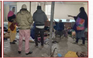
सेवा कार्य-अमराईवाड़ी ओढ़व