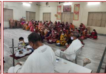
बारह व्रत कार्यशाला-दलखोला