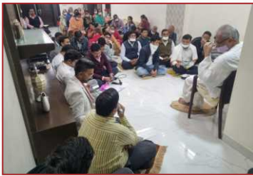
धम्म जागरण-साउथ कोलकाता